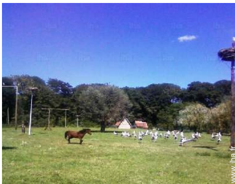
parc et jardin