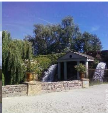
Attraits et détente