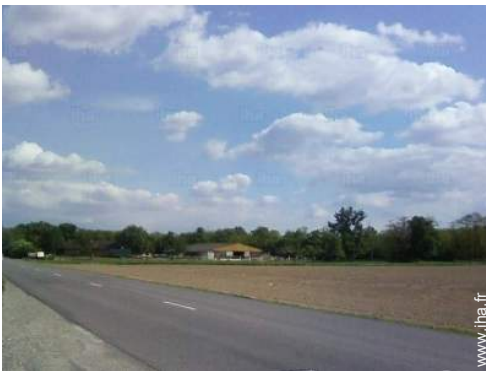
balade à cheval