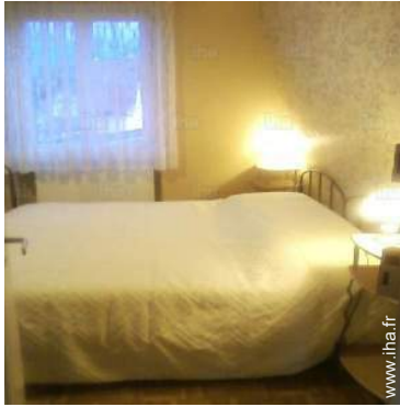
lits jumeaux simple