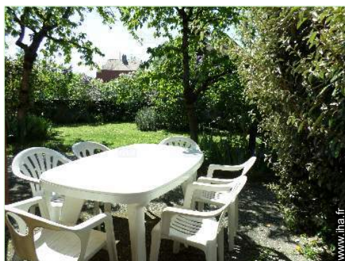
vue sur jardin/parc