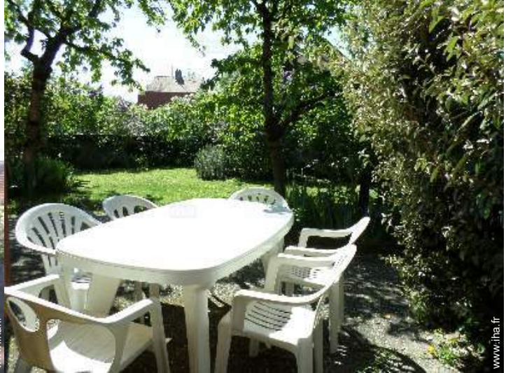
vue sur jardin/parc