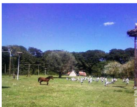
parc et jardin