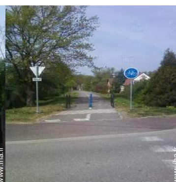
VTT (itinéraire circuit)