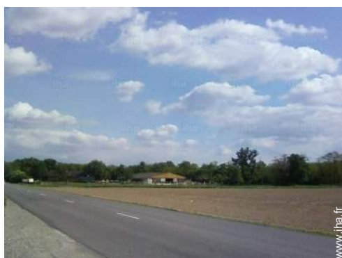
balade à cheval