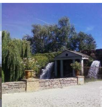
Attraits et détente