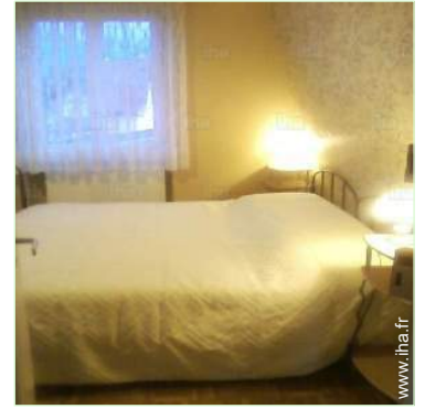
lits jumeaux simple