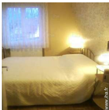
lits jumeaux simple