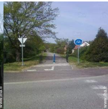
VTT (itinéraire circuit)