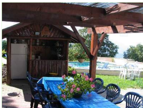
aménagement de loisirs