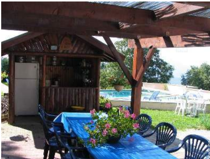
aménagement de loisirs