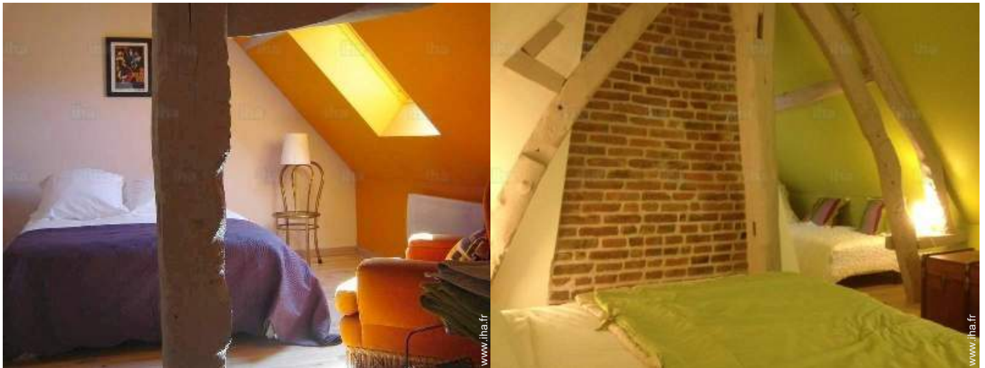
Couchage - lit(s)