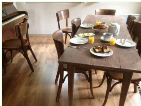
salle à manger