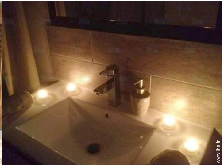
salle(s) de bain