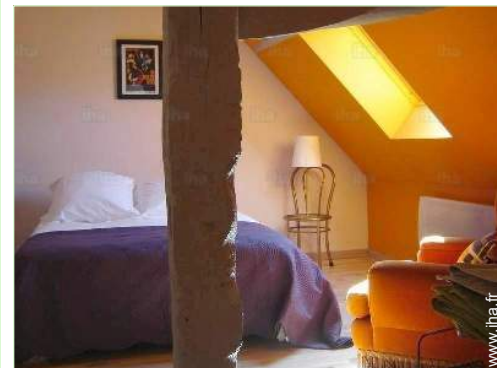
Couchage - lit(s)