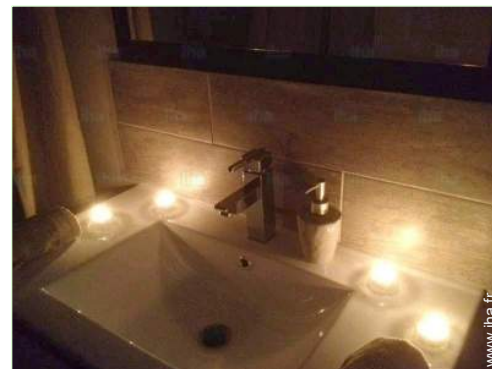
salle(s) de bain