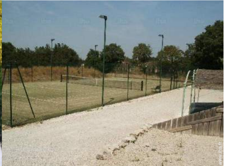
Tennis - gazon