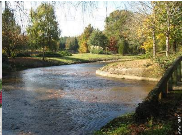
vue sur rivière