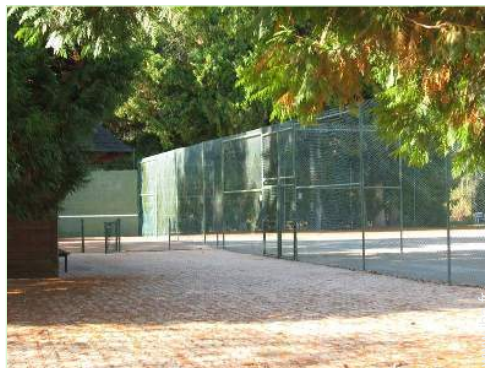
Equipements de loisir