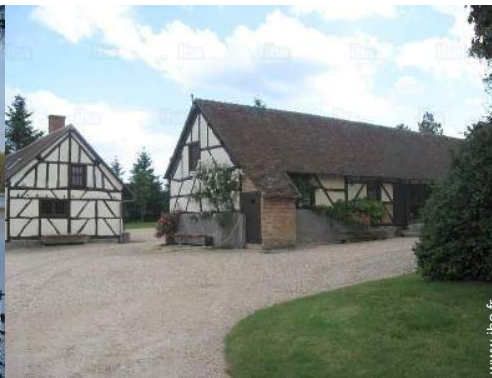
vue sur cour