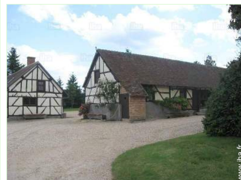
vue sur cour