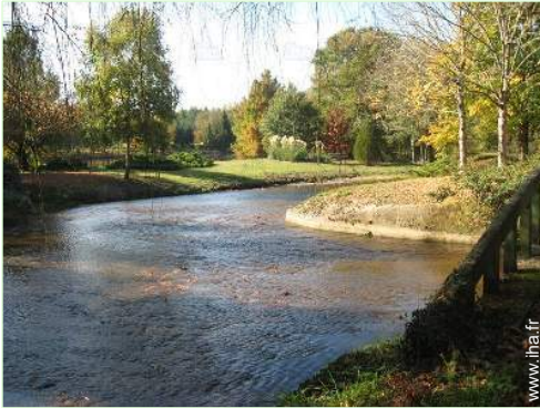
vue sur rivière