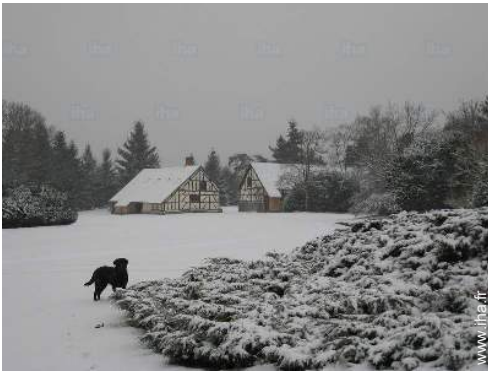
vue sur jardin/parc