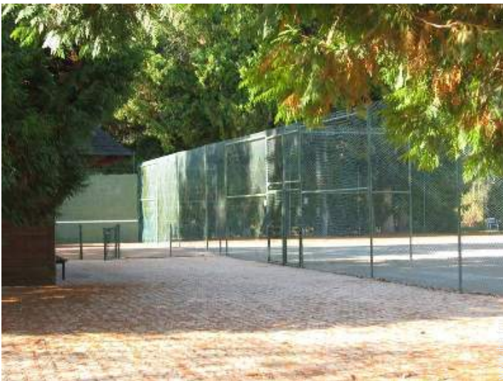
Equipements de loisir