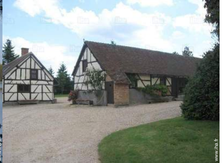
vue sur cour