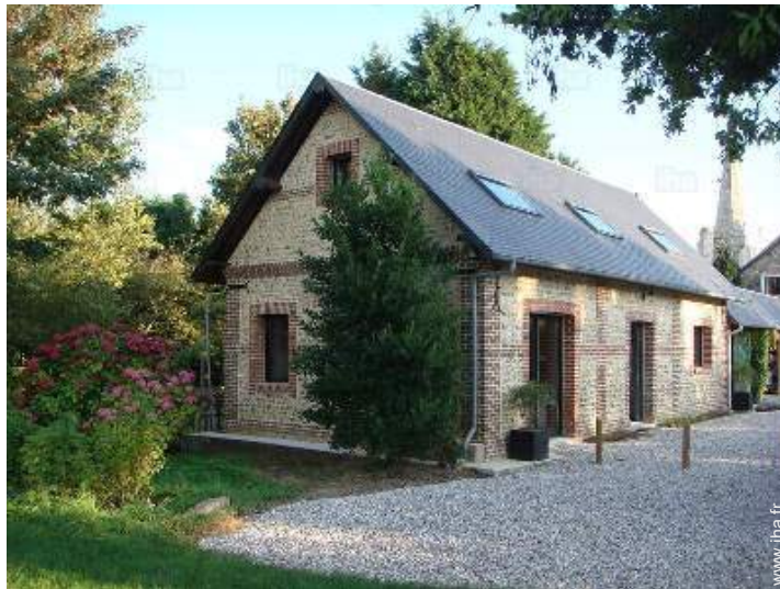
Maison de Charme en Pierre