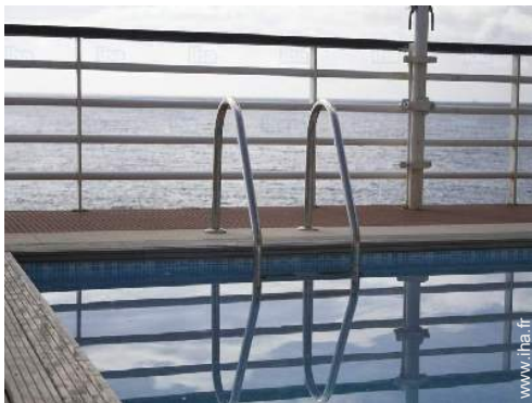
vue depuis la piscine