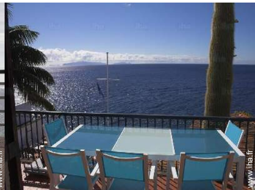
table(s) de jardin