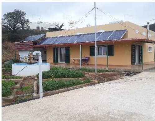
vue sur jardin/parc