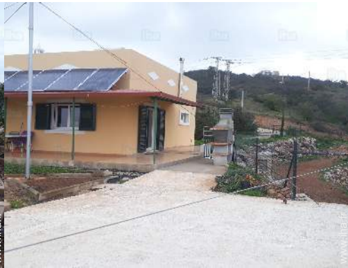
vue sur jardin/parc