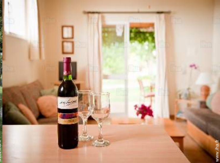
vue depuis la cuisine