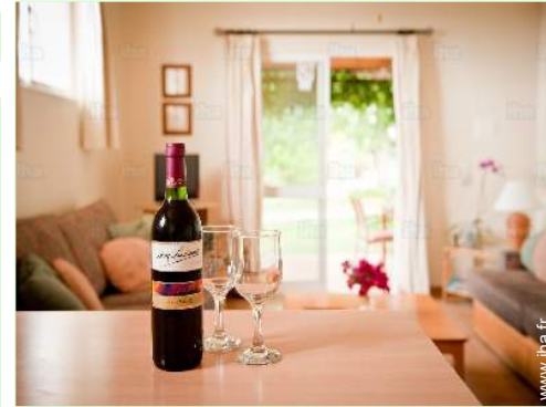
vue depuis la cuisine