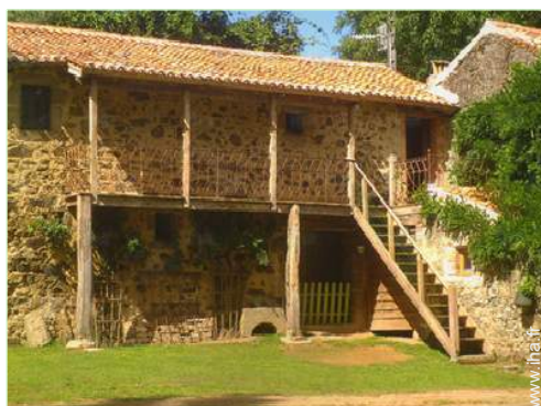
Maison de Campagne de Charme