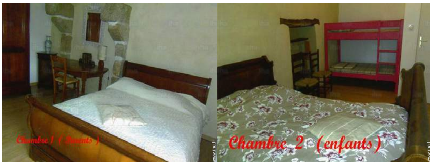
Chambre 1 (Parents)