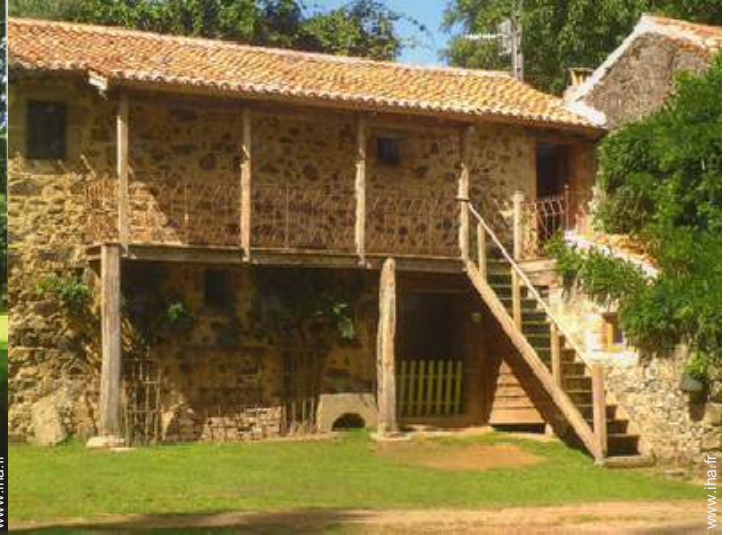
Maison de Campagne de Charme