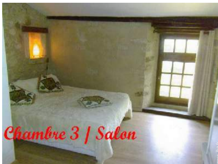
Chambre 3 / Salon