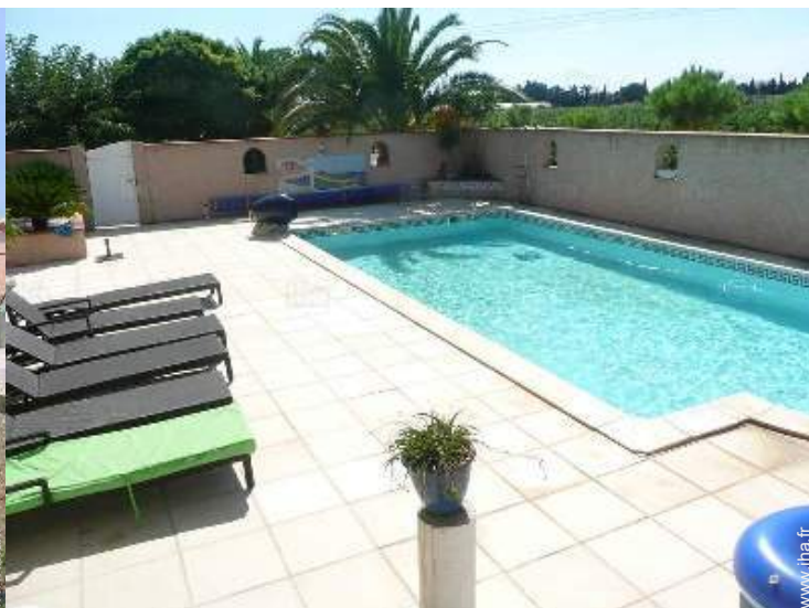
vue sur vignobles