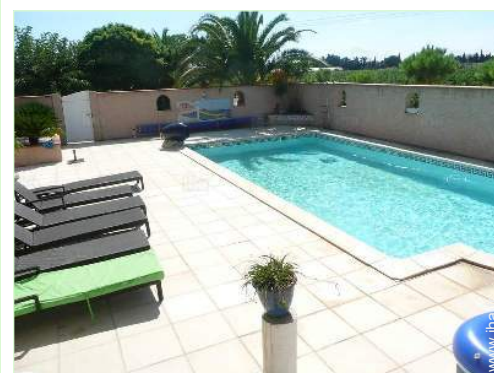
vue sur vignobles