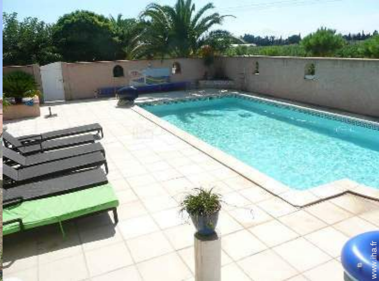
vue sur vignobles