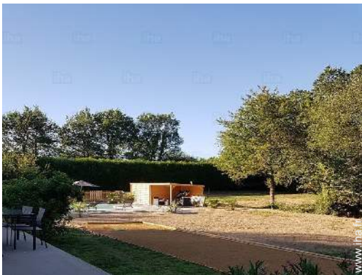
terrain de pétanque