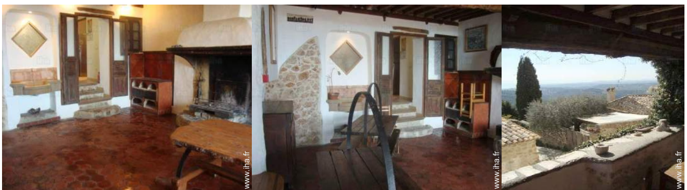
vue depuis l'appartement