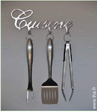
Equipements à disposition