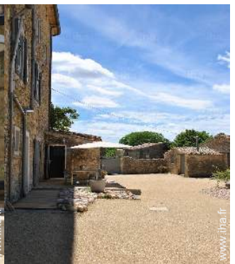
vue sur jardin/parc