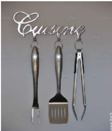
Equipements à disposition