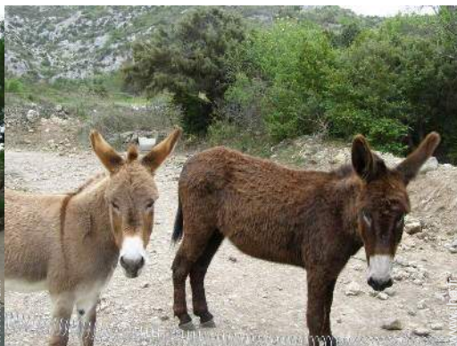
Les animaux de la maison