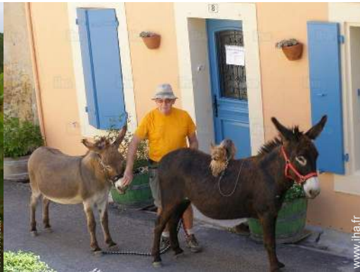
Les animaux de la maison