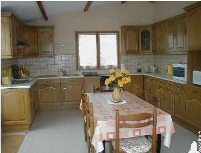
grande cuisine indépendante