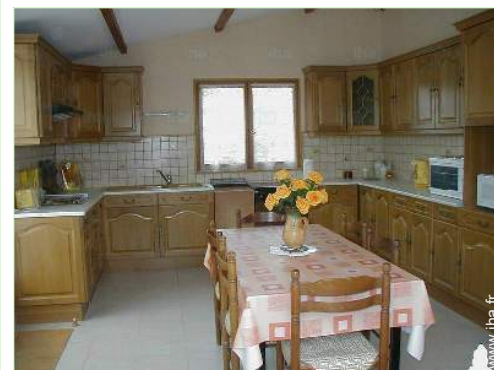
grande cuisine indépendante

Patinoire 20km Piscine chauffée 4km Piscine publique 4km Court de tennis public 4km Rivière 2km Plan d'eau 4km Cale de mise à l'eau pour bateau 15km