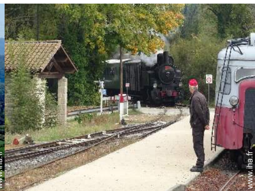
loisirs d'été à proximité