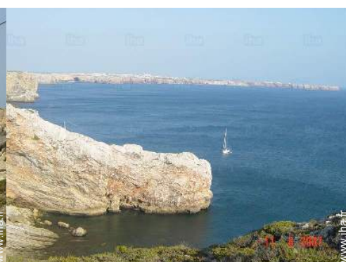
Attraits et détente