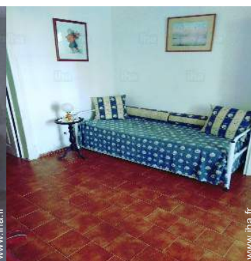
vue depuis le salon