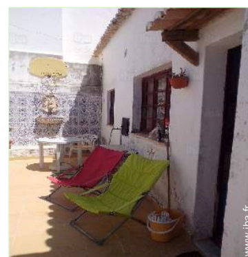
vue depuis le patio

Mer/océan 50m Plage de sable 50m Plage de rocher <50m Plage de naturisme 10km Parcours de golf 18 trous 15km Spot de windsurf 500m Spot de surf 200m Base nautique 500m Falaise 100m Forêt 5km Port de plaisance 500m Cale de mise à l'eau pour bateau 200m Via ferrata 20km