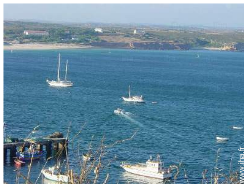
vue sur mer