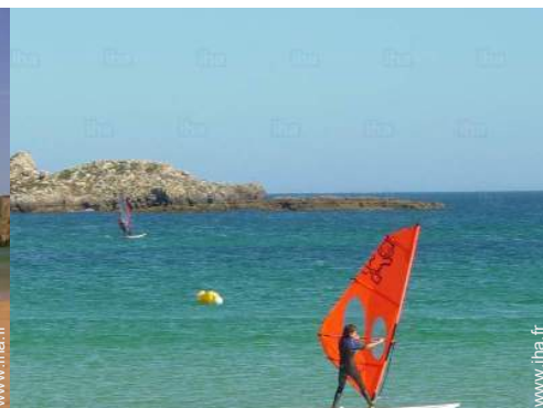
planche à voile