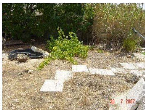
Cadre extérieur à disposition des hôtes