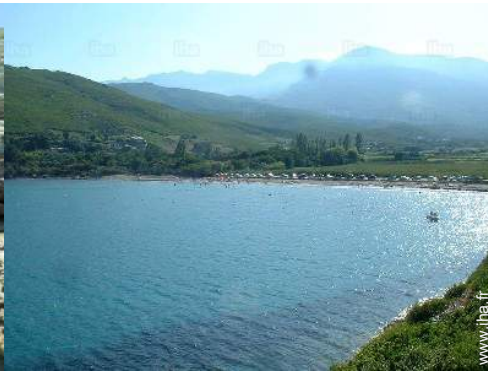
vue sur mer