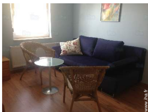
canapé-lit(s) 2 pers