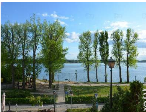
Villes à proximité