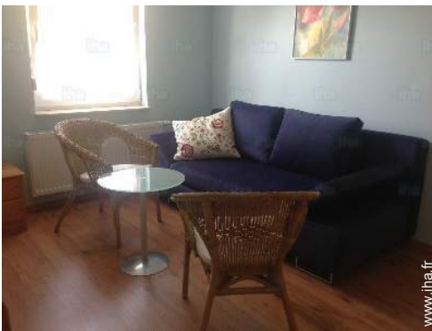
canapé-lit(s) 2 pers