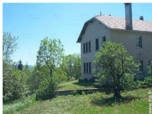
Maison de Campagne