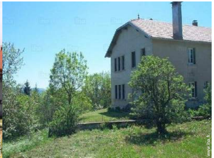
Maison de Campagne