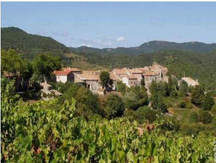
loisirs aériens à proximité