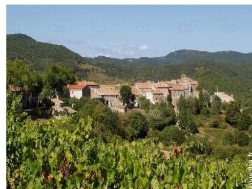
loisirs aériens à proximité