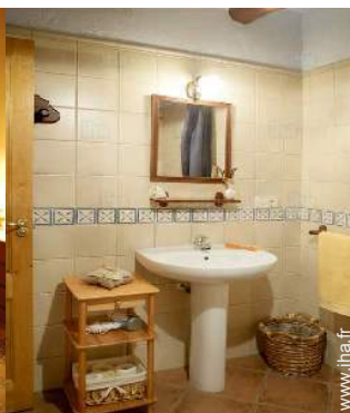
chambre de service