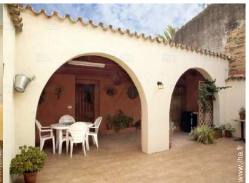
vue sur cour