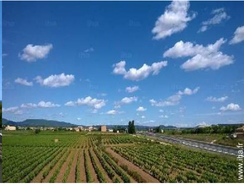
vue sur vignobles