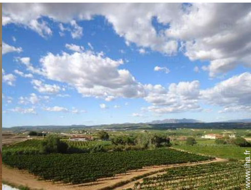
vue sur vignobles