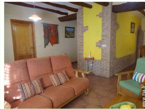
vue depuis le salon