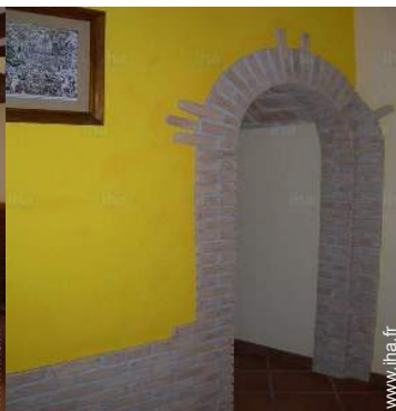
vue depuis la salle à manger