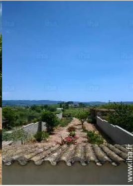
vue depuis la chambre