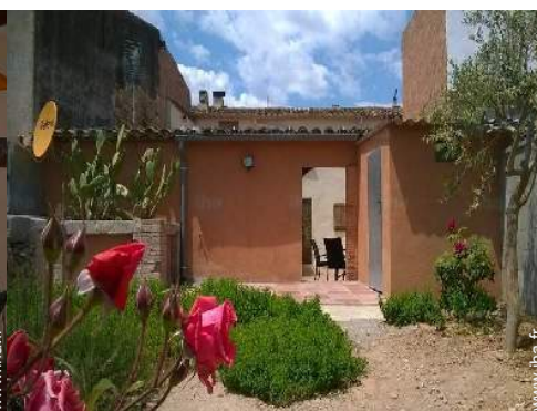
vue depuis le jardin/parc