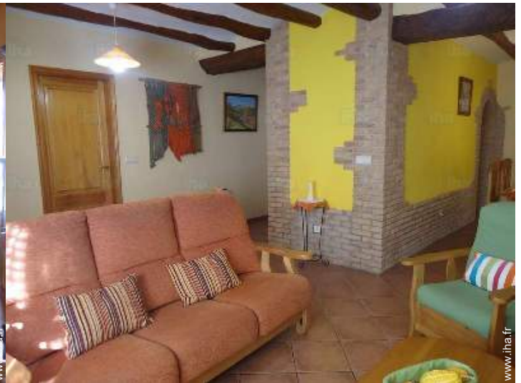
vue depuis le salon