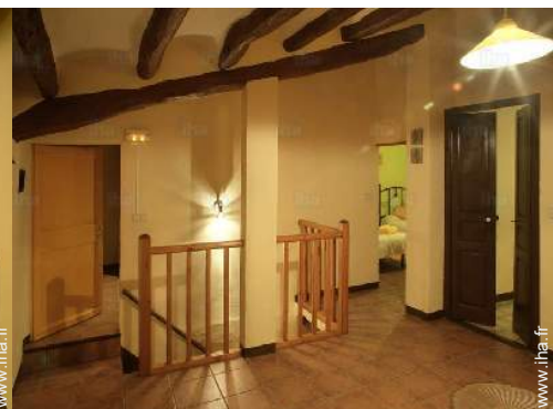
vue depuis la chambre