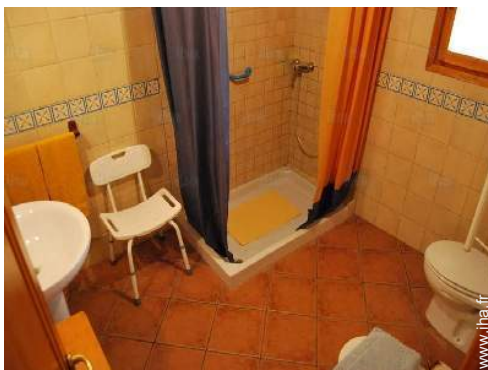
chambre de service