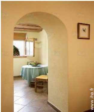
vue depuis la salle à manger