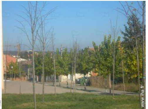
vue depuis la maison