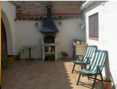
vue sur cour