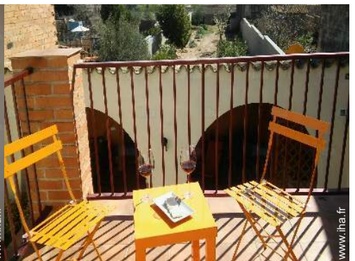
vue depuis la terrasse