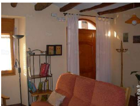
vue depuis le salon