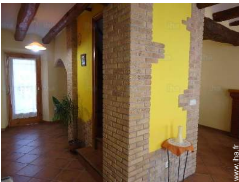
vue depuis le salon