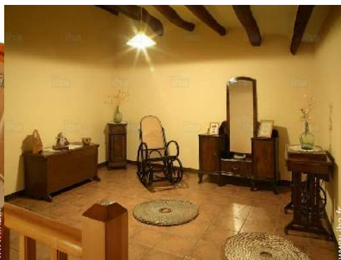
vue depuis la chambre