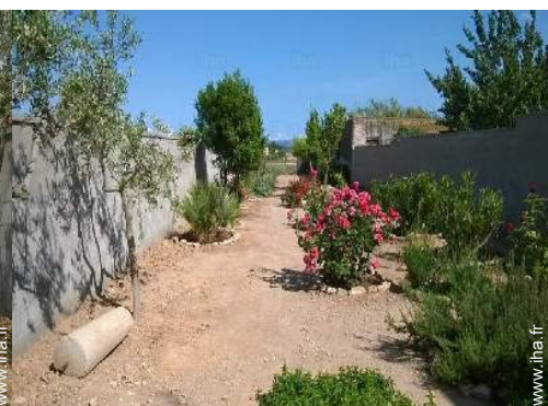
vue depuis le jardin/parc