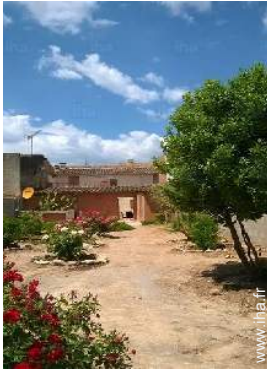
vue depuis le jardin/parc