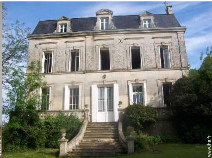
Maison de Maître