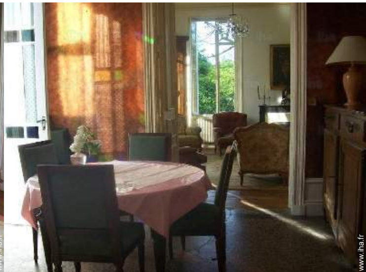
vue depuis la salle à manger