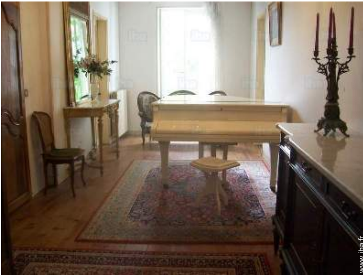
salon de musique