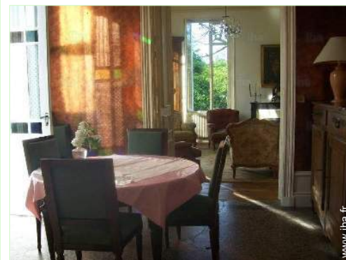
vue depuis la salle à manger

Centre ville 1,5km Boulangerie 1,5km Traiteur 1,5km Petits commerces 1,5km Super marché 1km Salon de coiffure 1,5km Poste 1,5km Banque 1,5km Distributeur automatique de billets 1,5km Pharmacie 1,5km Médecin 1,5km Infirmière 1,5km Hôpital 20km