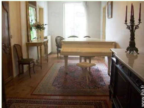
salon de musique