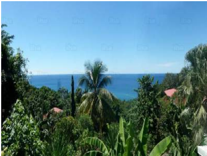
vue sur mer