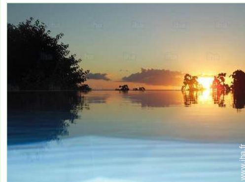
vue sur coucher de soleil