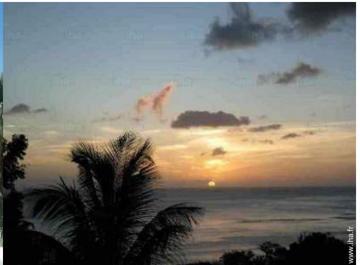
vue sur coucher de soleil