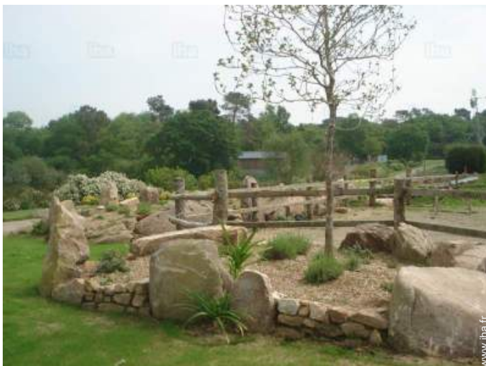
vue depuis le jardin/parc