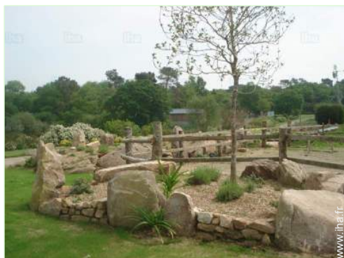
vue depuis le jardin/parc