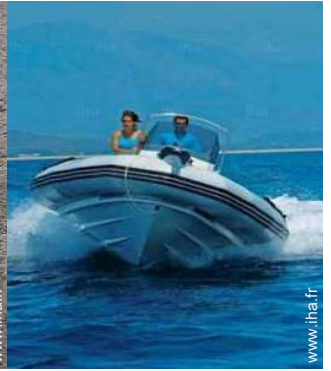
location de bateau