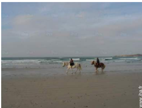
balade à cheval