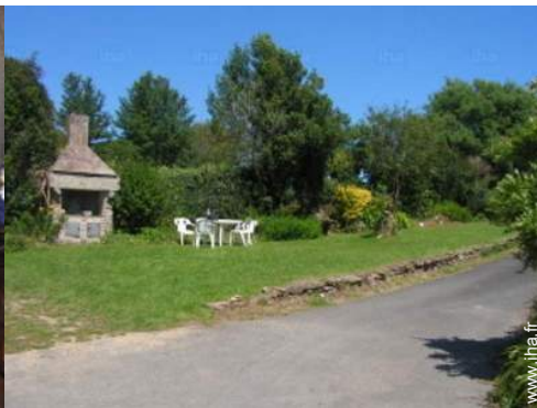
Installation extérieure à disposition des hôtes