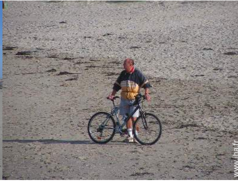
location de vélo/VTT