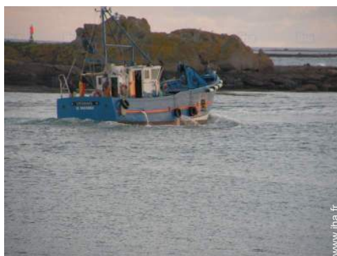
excursion en bateau