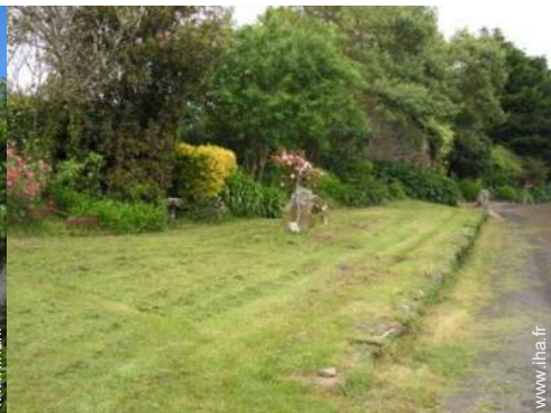
Cadre extérieur à disposition des hôtes