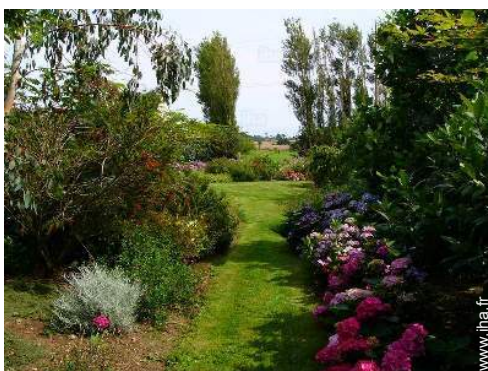
chemin de promenade