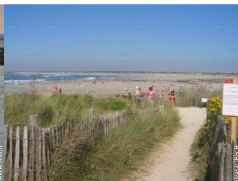
plage de naturisme