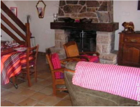
coin du feu