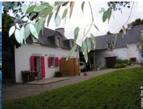
vue de la propriété