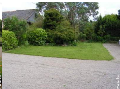
vue sur cour