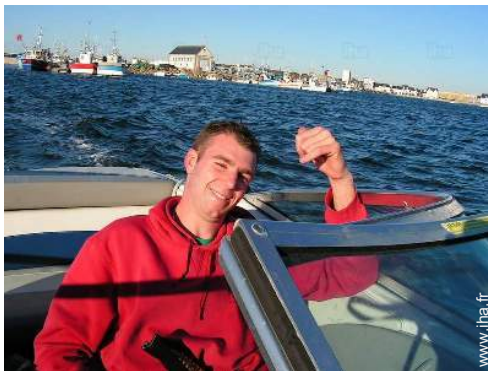
location de bateau