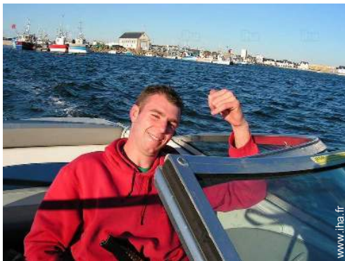
location de bateau