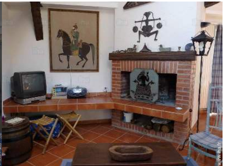
coin du feu