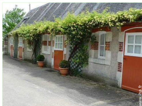
Maison de Charme en Pierre