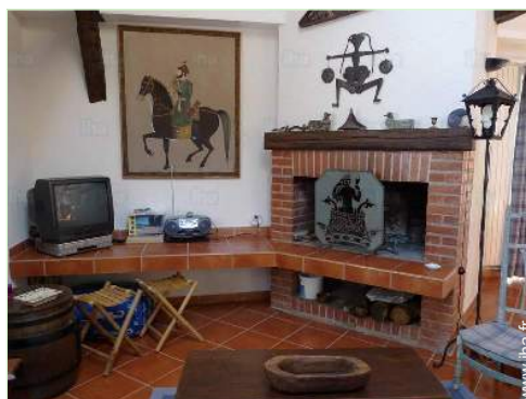
coin du feu