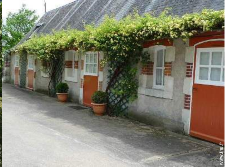
Maison de Charme en Pierre