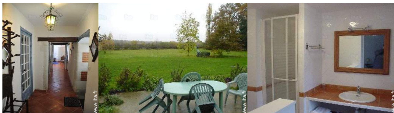
Agencement intérieur et commodités