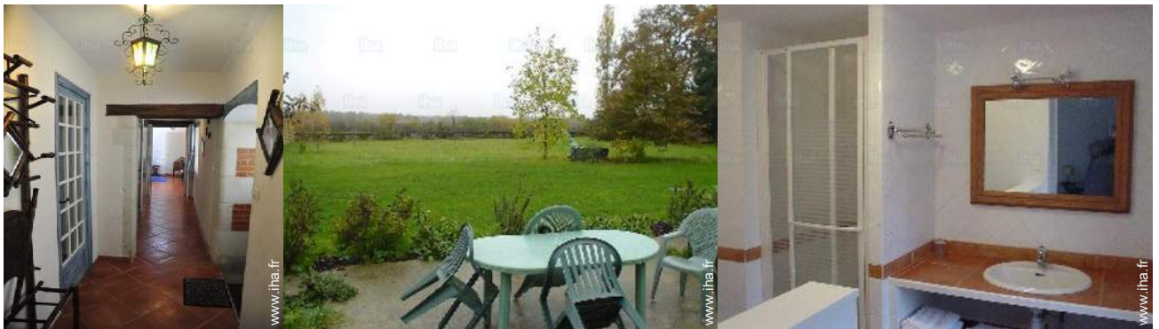
Agencement intérieur et commodités