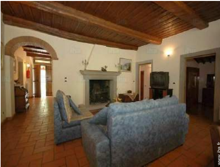
Confort intérieur et équipements