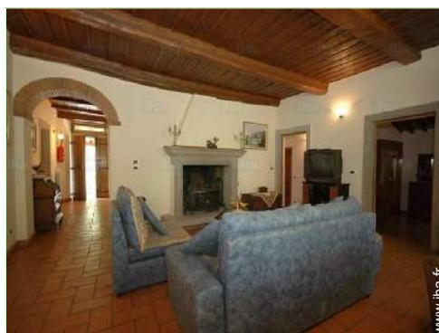
Confort intérieur et équipements