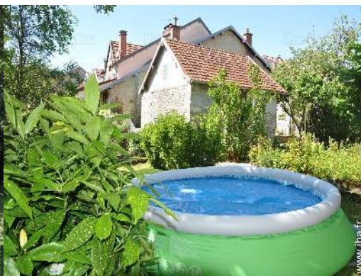
Equipements extérieurs à disposition des hôtes