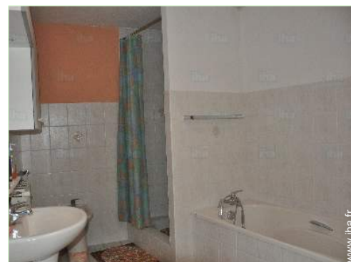
salle(s) de bain