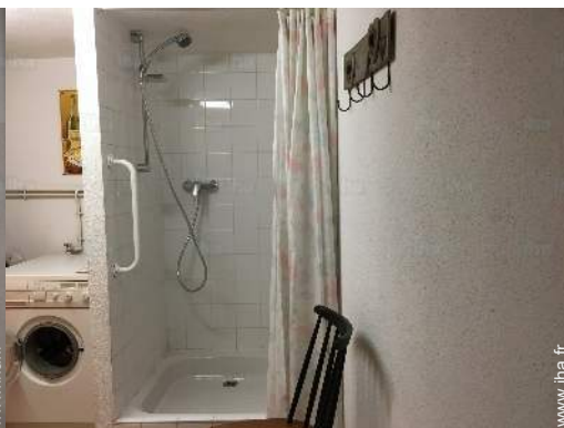
salle(s) de douche