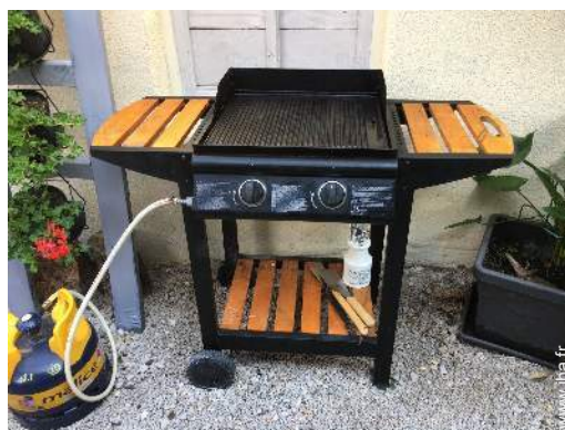
barbecue à gaz