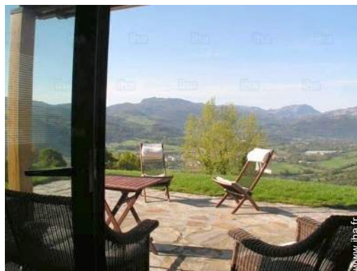
vue depuis la maison