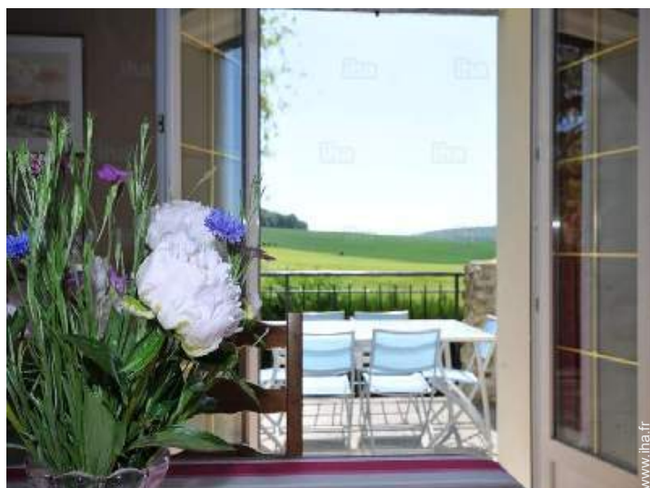
vue depuis la salle à manger