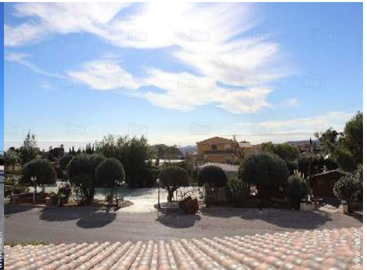
vue depuis la chambre