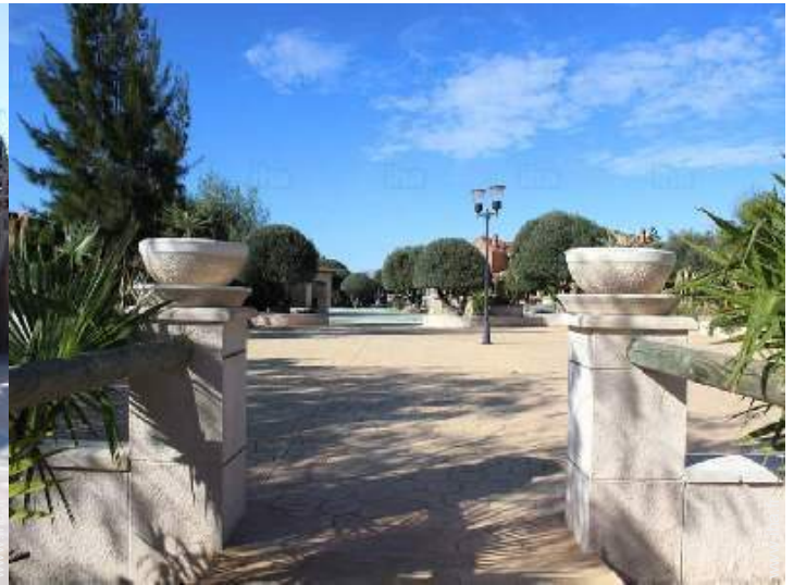
Equipements à disposition