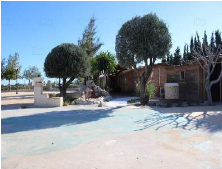
Equipements à disposition