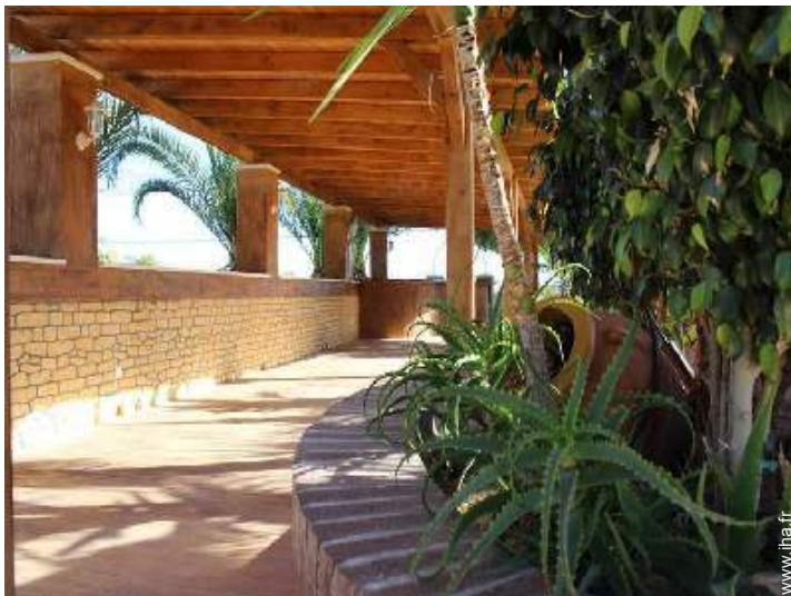
Equipements à disposition