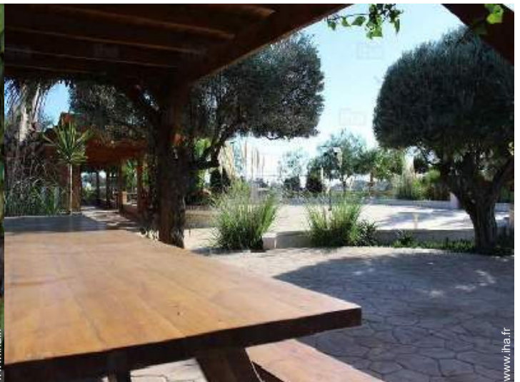
Equipements à disposition