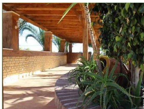
Equipements à disposition