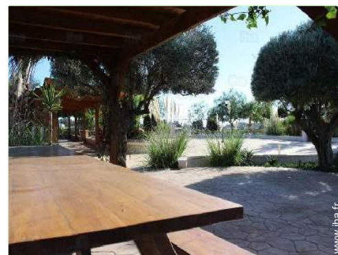
Equipements à disposition