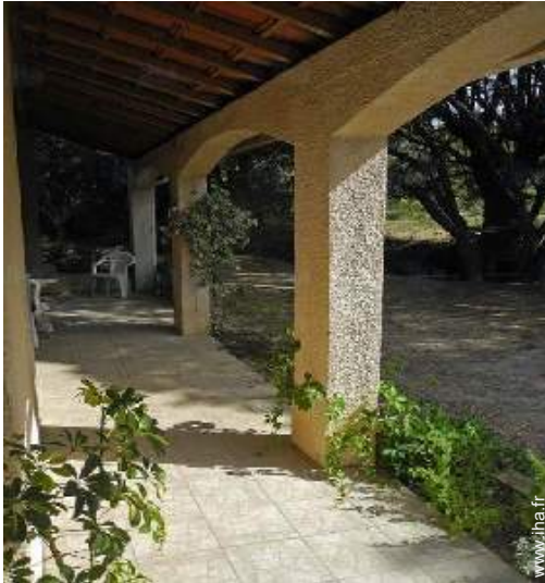
vue depuis la terrasse couverte