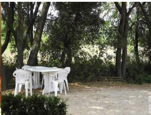
vue sur cour