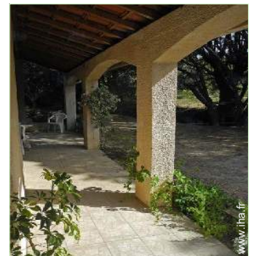
vue depuis la terrasse couverte

Centre village 800m Arrêt/station de bus 300m Tramways 10km Boulangerie 800m Traiteur 800m Petits commerces 800m Super marché 300m Salon de coiffure 800m Poste 800m Pharmacie 500m Médecin 500m Infirmière 500m Hôpital 10km