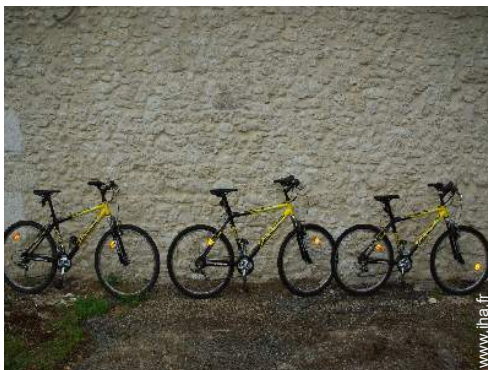
VTT (itinéraire circuit)