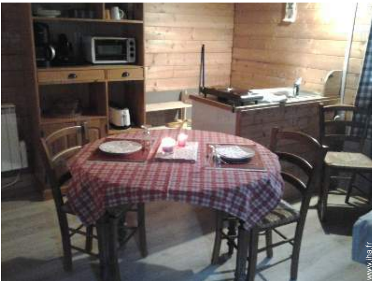
Cabane de Charme