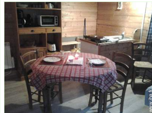
Cabane de Charme

Centre village 4km Liaison bus pistes de ski 4km Location de vélo/VTT 4km Location de matériel de ski 7,5km Boulangerie <50m Petits commerces 4km Super marché 2km Salon de coiffure 4km Poste 4km Banque 4km Distributeur automatique de billets 4km Pharmacie Médecin Infirmière Hôpital