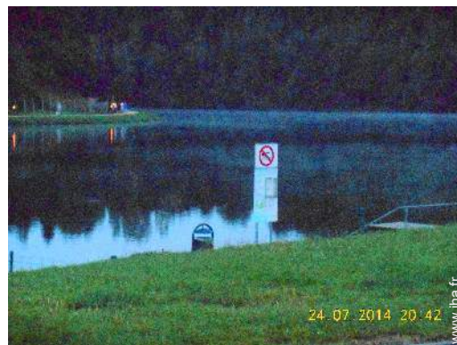
loisirs balnéaires à proximité