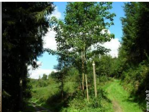
loisirs à proximité