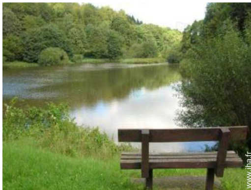
loisirs à proximité