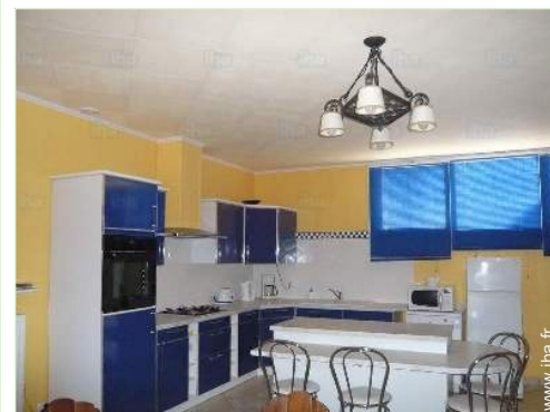
grande cuisine indépendante