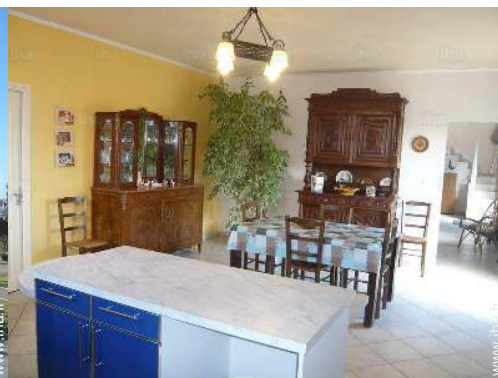
grande cuisine indépendante