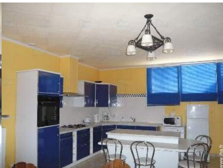
grande cuisine indépendante