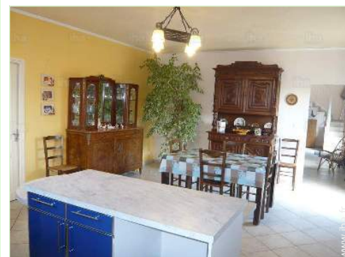
grande cuisine indépendante