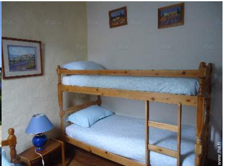
Couchage - lit(s)