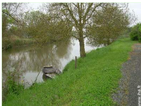
vue sur rivière