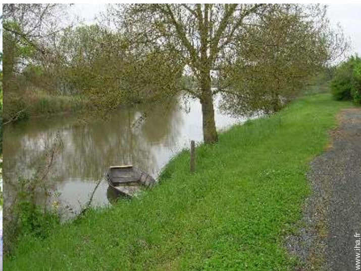
vue sur rivière