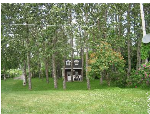
vue de la propriété