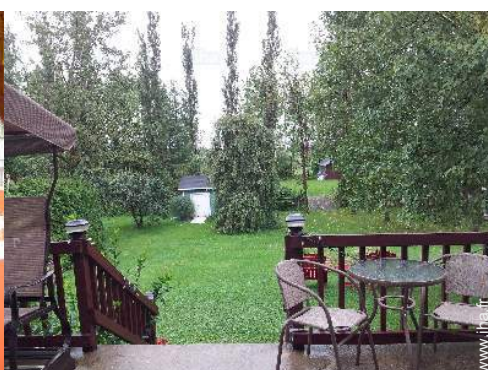
vue depuis la maison