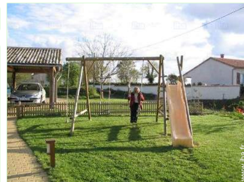
vue depuis la cuisine

Barbecue, table(s) de jardin, 4 chaise(s) de jardin, parasol, salon de jardin, 4 chaise(s) longue(s), 2 transat(s), bac à sable, douche extérieure