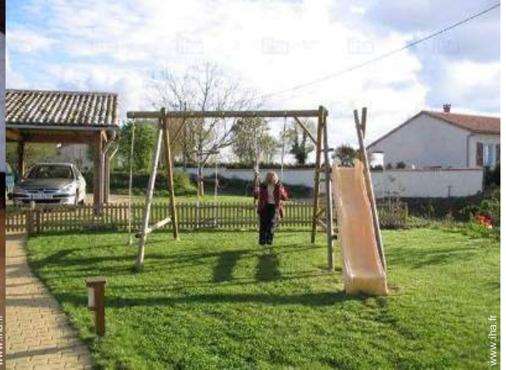
vue depuis la cuisine