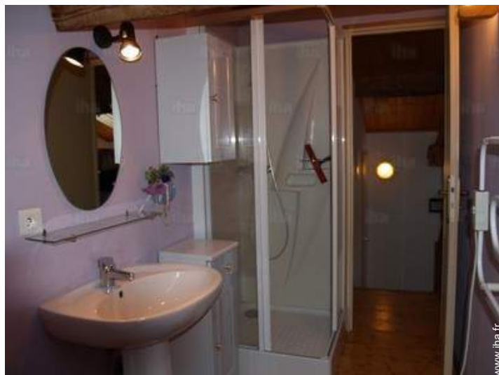
salle(s) de douche