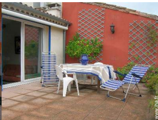
terrasse sur toit