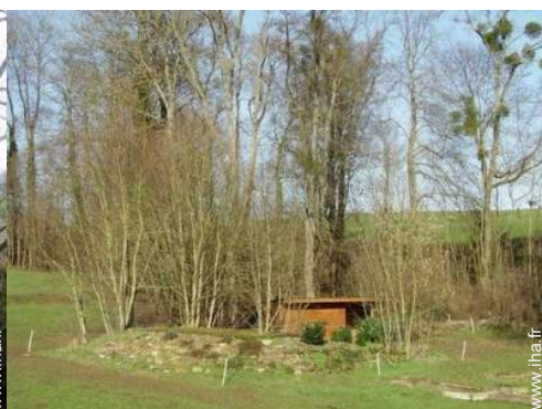
vue depuis le salon