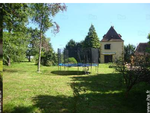
Equipements extérieurs à disposition des hôtes