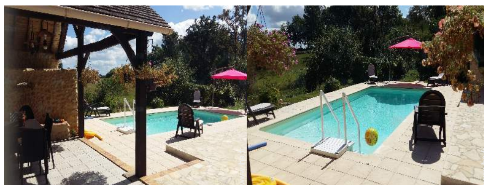
piscine dans la résidence