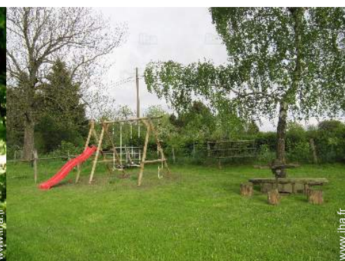
Equipements de loisir