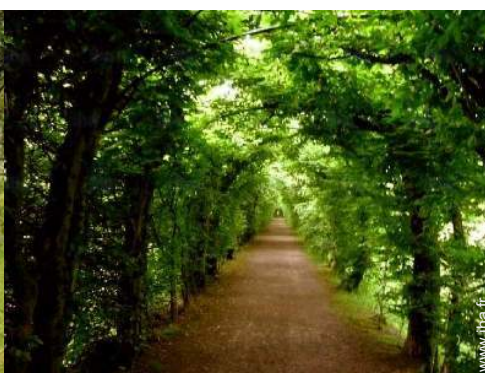
chemin de promenade