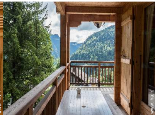
vue depuis la terrasse