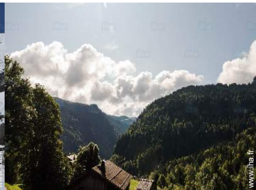
vue sur montagne