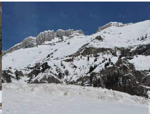
vue sur montagne