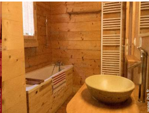
salle(s) de douche