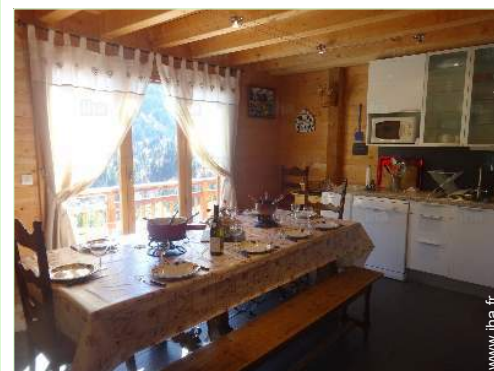
salle à manger