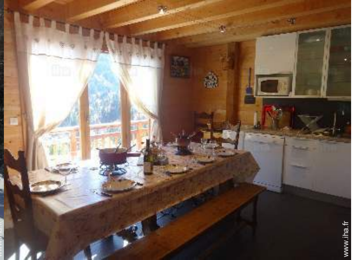
salle à manger