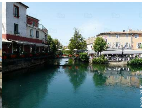
vue sur ville