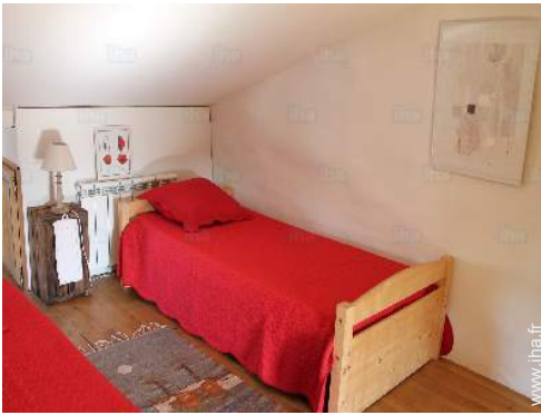
lits jumeaux simple