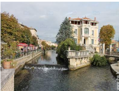
vue sur centre ville