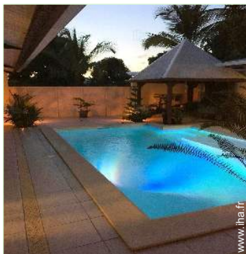
piscine dans la résidence