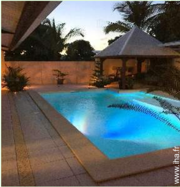
piscine dans la résidence