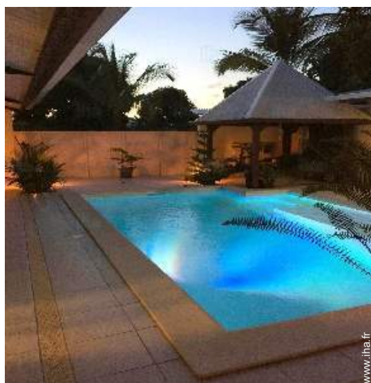
piscine dans la résidence