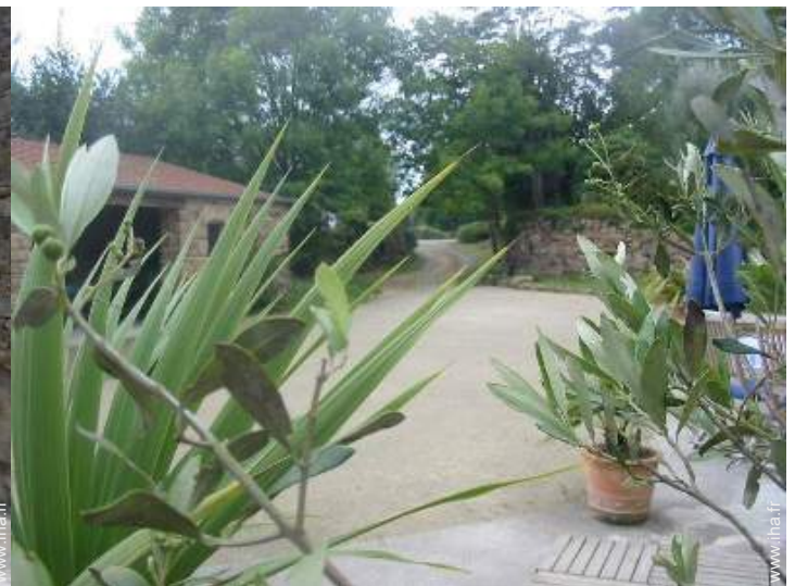
vue sur cour